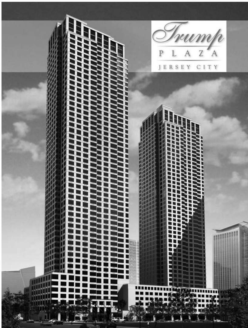
Wizualizacja Centrum Trumpa w Jersey City w New Jersey